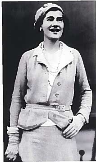
Foto af Coco Chanel i 1936

Coco Chanel går selv foran i et opgør med den pyntede kvinde og er med til at frigøre kvinderne fra korsettet og marengskjolen, så de kan danse til tidens toner. Af samme grund kårer TIME Magazine Coco Chanel som en af de 100 mest indflydelsesrige personer i det 20. århundrede.