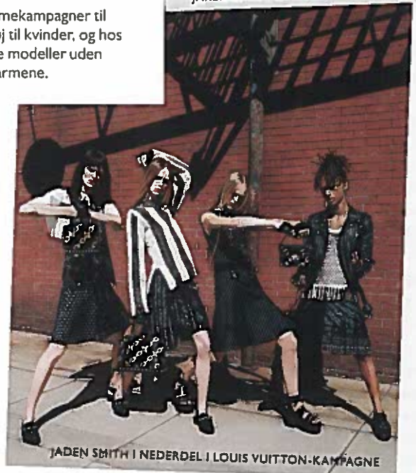
JADEN SMITH I NEDERDEL I LOUIS VUITTON-KAMPAGNE