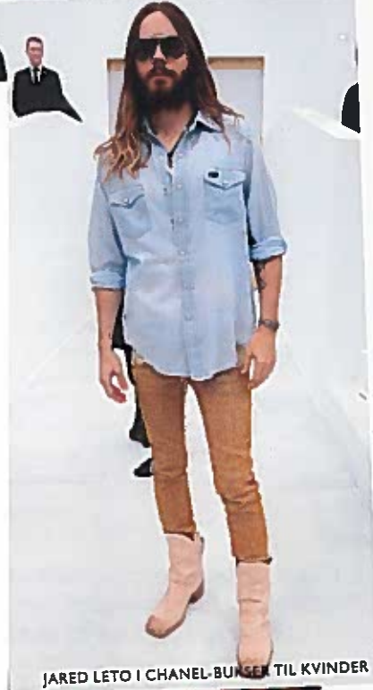
JARED LETO I CHANEL-BUNSEN TIL KVINDER

5. De store modehuses S/S 16-reklamekampagner til kvinder er fyldt med herremodeller i tøj til kvinder, og hos Proenza Schouler ser man kvindelige modeller uden makeup og med hår under armene.