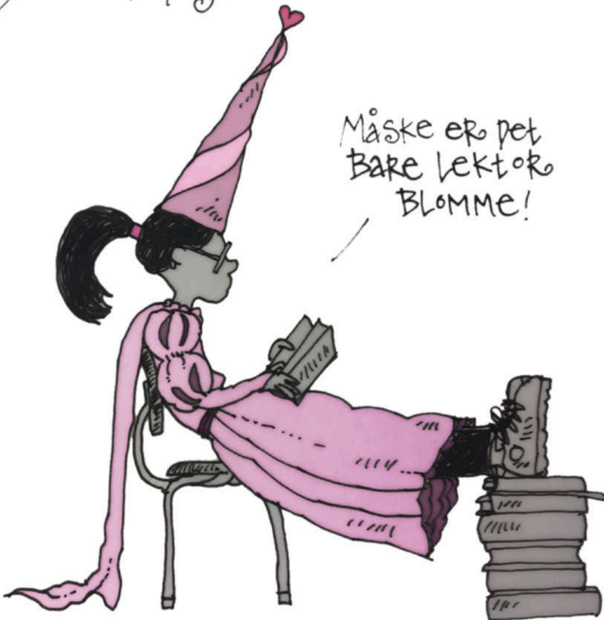
TEGNING: THORGERD BRONI JENSEN

Hun giver et eksempel: Vi bruger begrebet "12-talspige" flittigt, mens "12-talsdreng" slet ikke eksisterer i sproget. Det er ifølge Cecilie Nørgaard et tegn på, at vi har en stereotyp forestilling om, at drenge er mindre skoleegnede.